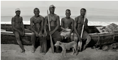
#1 Men on Pirogue, Djotin Plage, Ouidah, Benin, 2011

a) ca. 61×115 cm (Blatt), ca. 51×83 cm (Motiv), Auflage: 25 Exemplare, je Blatt 4.900 Euro b) 107×203 cm (Blatt), ca. 90×146 cm (Motiv), Auflage: 10 Exemplare, je Blatt 7.900 Euro