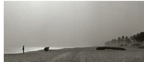
#2 Plage Ouidah, Benin, 2011