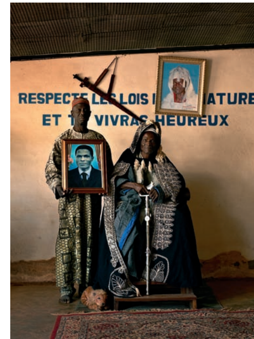
#9 King of Ouassa Pèhunco and Sariki Zongo, Salone d'Accueil, Pèhunco, Benin, 2011